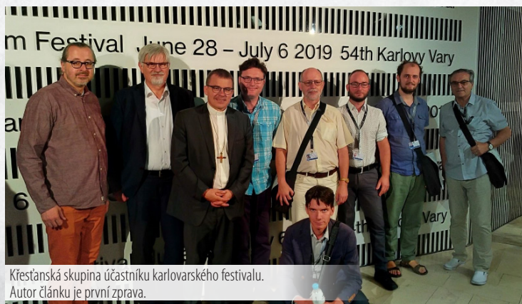
Křesťanská skupina účastníku karlovarského festivalu. Autor článku je první zprava.

Intolerance (1916) Davida Warcka Griffitha, Řím, otevřená město (1945) Roberta Rosselliniho, Život je krásný (1946) Franka