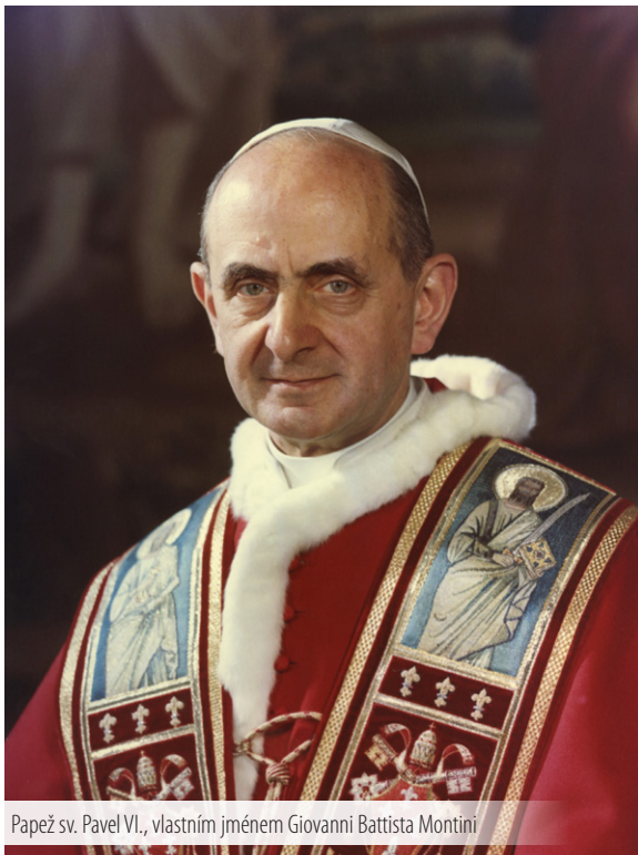
Papež sv. Pavel VI., vlastním jménem Giovanni Battista Montini

kongresu v indické Bombaji, kde adresoval, opět v duchu II. vatikánského koncilu, vstřícná slova hinduistům a vyznavačům jiných nekřesťanských náboženství. Téhož roku navštívil zasedání Valného shromáždění OSN v New Yorku, kde apeloval na mír mezi státy a národy.