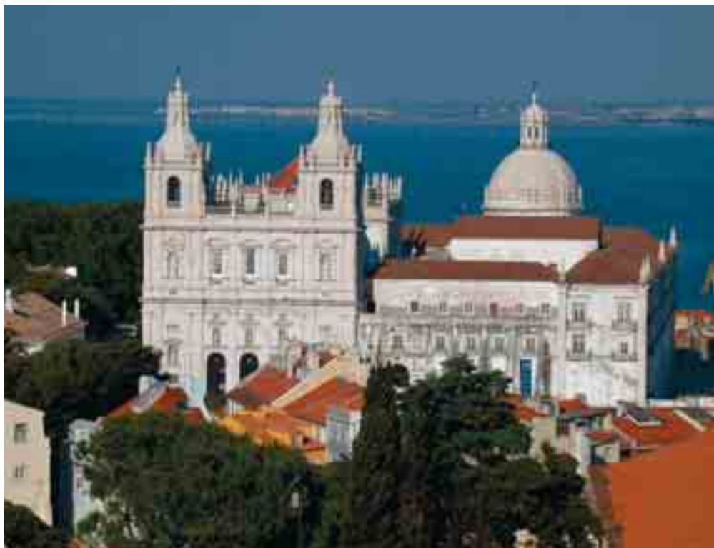
Klášter sv. Vincence v Lisabonu.

„K čemu jsou nápoje lásky, můj drahý?“ radil mu usměvavě. „V Lisabonu žije dost žen, které se v jejich přípravě vyznají.“ A poukázal na uličky, kde bylo snadné je najít; ale Fernando nemo-