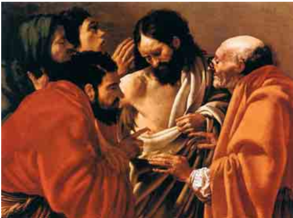
Hendrick TERBRUGGHEN, Nevěřící Tomáš (r. 1604), Rijksmuseum, Amsterdam