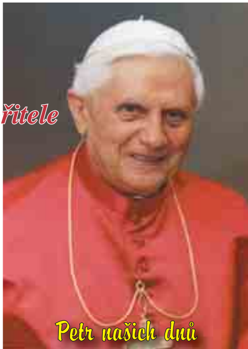
Petr našich dnů

Pokřtěný, který v Kristu zemřel hříchu, se rodí k novému životu a znovu a zadarmo je obdařen důstojností syna Božího. Proto byl v prvotním křesťanském společenství křest považován za „první vzkříšení“ (srv. Zj 20,5; Řím 6,1-11; Jan 5,25-28). Postní doba je tedy již od samého začátku prožívána jako období bezprostřední přípravy na křest, který je slavnostně udělován během velikonoční vigílie. Celá postní doba byla cestou k tomuto velkému setkání s Kristem, k tomuto ponoření v Krista a obnovení života. My už jsme pokřtěni, ale křest v našem životě velmi často není moc účinný. Proto je postní doba i pro nás opětovným