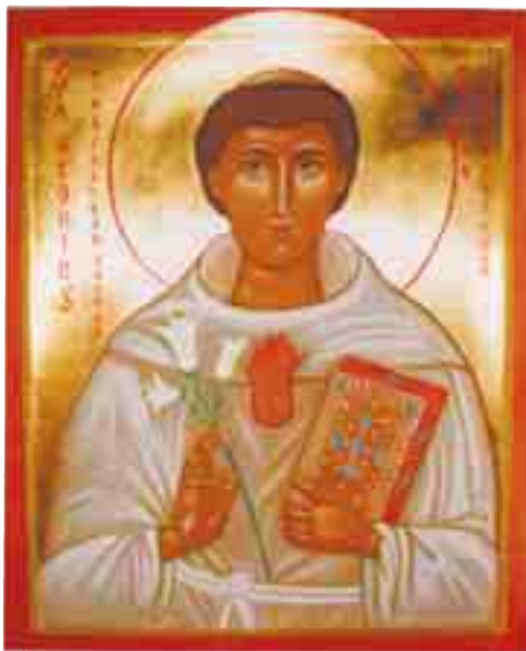
Ikona svatého Antonína, Tereza Enriques (21. stol.)

Copak by to mělo znamenat? Že bychom zlo nemohli nazvat zlem? Můžeme! Dokonce je naší po-