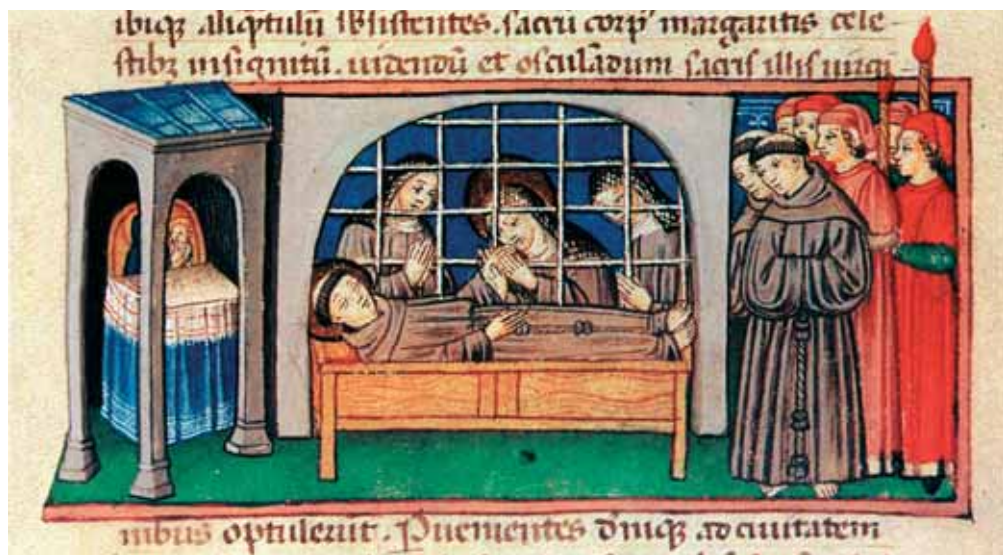
Sv. Klára líbá stigmata sv. Františka, miniatura na pergamenu z roku 1457

A kdokoli je bude zachovávat, ať je v nebi naplněn požehnáním nejvyššího Otce a na zemi ať je