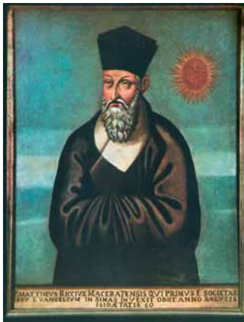
Matteo Ricci (1552-1610), italský jezuita, od r. 1582 misionář v jižní Číně. Jeho katechismus (r. 1584) „Pravé učení o Pánu nebes“ byl vedle sedmi dalších jeho děl přijat do kánonu klasické čínské literatury.

Imaginární dialog mezi čínským filosofem a západním spisovatelem má svůj šťastný konec. Konfucián, aniž by musel popřít sebe samého, nakonec po 592 argumentacích přijímá pravdu křesťanství a konvertuje. Skutečná historie křesťanství v Číně však není tak jednoduchá. Více jak 100 let po smrti o. Mattea Ricciho roku 1715 papež Klement XI. definitivně zrušil tzv. „čínský ritus“, což byl právě pokus jezuitů v Číně, který započal o. Ricci, využít některé čínské pojmy a zvyky a zavést je do katecheze i liturgie. To však bylo čínským císařem přijato s velkou nelibostí, i přesto, že se zákaz týkal pouze čínských katolíků, kterých bylo v zemi jenom zcela nepatrné množství, a že se zabýval jen interními církevními záležitostmi. Pro Čínu, která na rozdíl od Evropy neměla pojem o dualitě dvou mocí – světské a duchovní – bylo zkrátka nepřipustné, aby se kdokoli vměšoval do vnitřních záležitostí země, což způsobilo, že se křesťanství muselo nejen obejít bez politické pod-