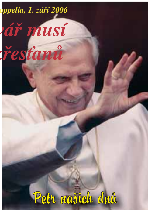
Petr našich dnů

Když jsem se před chvílí modlil, myslel jsem na první dva Apoštoly, kteří povzbuzeni Janem Křtitelem, následovali Ježíše u řeky Jordán – jak čteme na začátku Janova evangelia (srv. J 1,35-37). Evangelista vypráví, že Ježíš se k nim obrátil a zeptal se jich: „Co hledáte?“ Oni odpověděli „Rabbi, kde bydlíš?“ A on: „Pojďte a uvidíte“ (srv. J 1,38-39). Ještě tentýž den jej oba následovali a učinili nezapomenutelnou zkušenost, která je přiměla říci: „Našli jsme Mesiáše!“ (J 1,41). Ten, koho před chvílí považovali za obyčejného „rabbiho“, obdržel velmi přesnou totožnost, staletými očekávanou totožnost Krista. Jak dlouhou cestu však ještě ve skutečnosti měli tyto učedníci před sebou! Nedovedli si ani představit, jak hluboké by mohlo být tajemství Ježíše z Nazareta; jak nezbadatelnou a záhadnou by se mohla ukázat jeho „tvář“. Dokonce tak, že po třech letech prožitých společně uslyší jeden z nich, Filip, při poslední Večeři: „Tak dlouho jsem s vámi a ty mne neznáš, Filipe?“ A potom následují slova, která vyjadřují veškerou novost Ježíšova zjevení: „Kdo viděl mne, viděl Otce“ (J 14,9). Teprve po jeho Utrpení, když jej potkají vzkříšeného a když Duch osvítí jejich mysl i jejich srdce, apoštolové porozumějí významu slov, která jim Ježíš řekl, a uznají v Něm