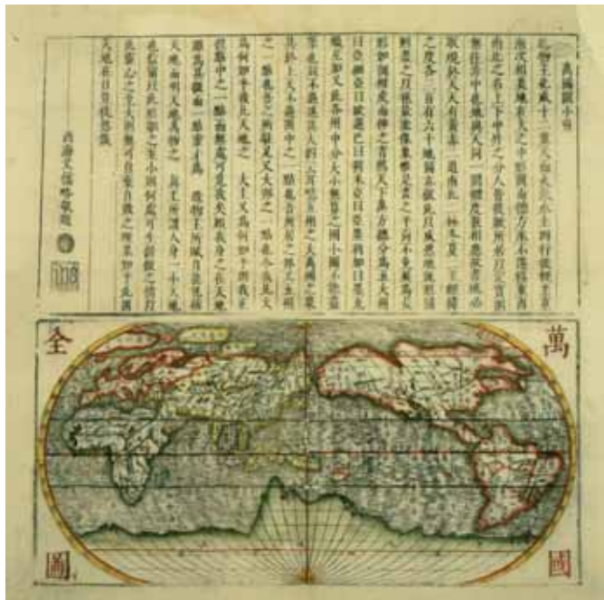
Čínská mapa světa z r. 1620

od Marka Pola, který poznal jen mongolskou císařskou dynastii a který se nikdy nenaučil čínsky, začal se tento jezuitský kněz učit mandarínskou čínštinu i zvyky většinového čínského etnika Han. Obléká se jako mandarin. Oproti františkánům a dominikánům, kteří přišli do Číny o něco dříve, nepřichází sem a nevstupuje zde v duchu eurocentrismu. Dává si jméno Li Madou a Číňané mu později dali čestné jméno Xitai - Učitel Západu. Vylodil se v Číně roku 1583 ve svých 31 letech. A teprve po 24 letech, když se dokonale seznámil s východní civilizací, rozhodl se k zásadnímu kroku a napsal Katechismus. Odmítl buddhismus a taoismus, jež se jeví nejvíce nepřátelskými vůči křesťanství, a snažil se