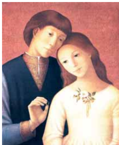
Ilustrace: Bradi Barth

Muž a žena jsou stvořeni pro sebe navzájem. V symbolické řeči Bible to znamená, že člověku není protějškem žádná zvíře, které by mu chybělo a bez kterého by byl sám (Gn 2, 20). Víme, jak je smutné, když má nějaká domácí zvíře vyplnit lidskou samotu (Kat. 2418). Rovnocenným partnerem může být mužovi jen žena. Ale oba proto nejsou nedokonalé součásti, které by bylo třeba doplnit. Jsou samostatnými osobami, které mají být jeden pro druhého pomocí. Jejich vzájemnou přitažlivost nevysvětluje Bible tak jako řecký mýtus tím, že každý z nich se stal z trestu od bohů „polovinou“ člověka a že od té doby se obě poloviny zoufale hledají. Láska mezi mužem a ženou je darem samého Boha. Její krása, její oheň, její nezničitelná moc (srov. Pís 8, 6), její věrnost a plodnost jsou v Písmu svatém často užívané obrazy, mající vyjádřit vřelou lásku Boha k člověku (Kat. 796).