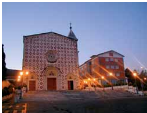
Kapucínský kostel "Svaté tváře" v Manoppellu.

Toto je jistota, která oživovala svaté vášeho kraje, mezi nimiž bych rád zmínil zvláště Gabriela od Bolestné Panny Marie a Kamila de Lellis; jim patří naše uctivá vzpomínka a naše modlitba. Se zvláštní myšlenkou úcty se však nyní obracíme na „Královnu všech svatých“, Pannu Marii, kterou ctíte v mnoha svatyních a kaplích roztroušených v údolích a horách kraje Abruzzo. Kéž nám pomáhá Matka Stvořitelova také při respektování přírody, velkého Božího daru, který zde můžeme obdivovat, když hledíme na úžasné hory, jež nás obklopují. Tento dar je však stále vystaven vážnému nebezpečí znehodnocení a je tedy třeba jej bránit a chránit. Je to naléhavost, která, jak pozname-