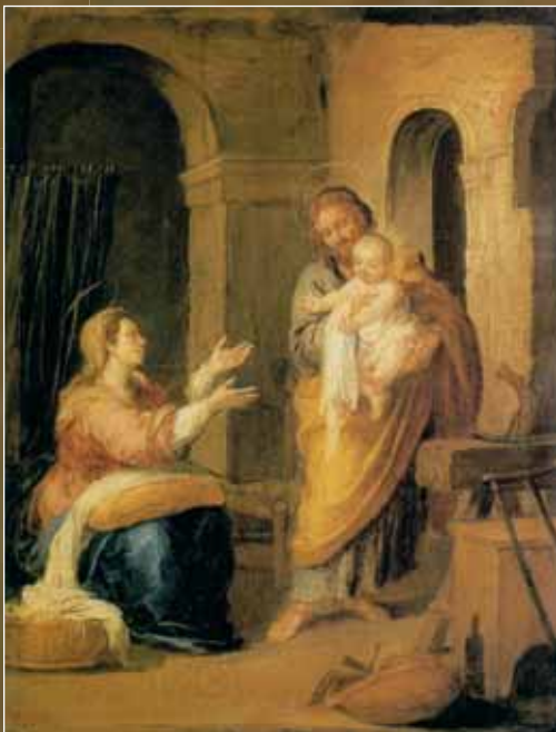
Svatá Rodina (1662), Bartolomé Esteban MURILLO, Sevilla, Španělsko

Ach, nazaretská školo ctností, kéž učení tvé chápu rád, jít cestou denních povinností a přitom Boha milovat!