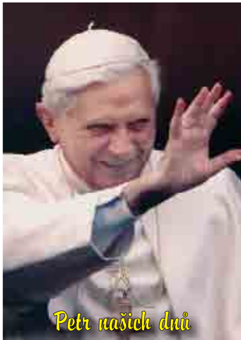
Petr našich dnů

Takže vnitřní struktura jejího modlitebního zpěvu je chvála, díkuvzdání, vděčná radost. Ale toto osobní svědectví není osamělé, intimní, protože Panna Maria si je vědoma, že má splnit poslání pro lidstvo a její životní osud zapadá do nitra dějin spásy: „a jeho milosrdenství trvá od pokolení do pokolení k těm, kdo se ho bojí“ (v. 50).