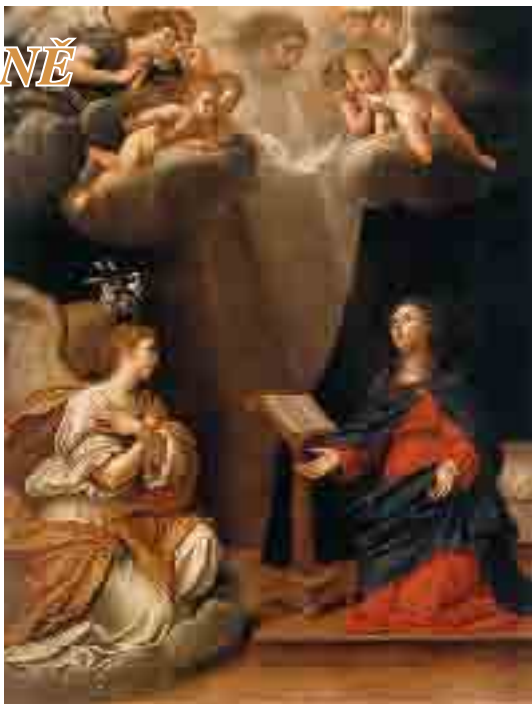
Zvěstování, Francesco Albani, Poustevna v Petrohradě

Boží působení v dějinách spásy se neděje pošlapáním lidské svobody. Bůh jedná s Marií jako se svobodnou bytostí. Uskutečňování spasitelného Vtělení nastalo až po jejím souhlasu. Maria svůj souhlas vyjadřuje slovy: „Jsem služebnice Páně“, které též nazýváme Mariiným