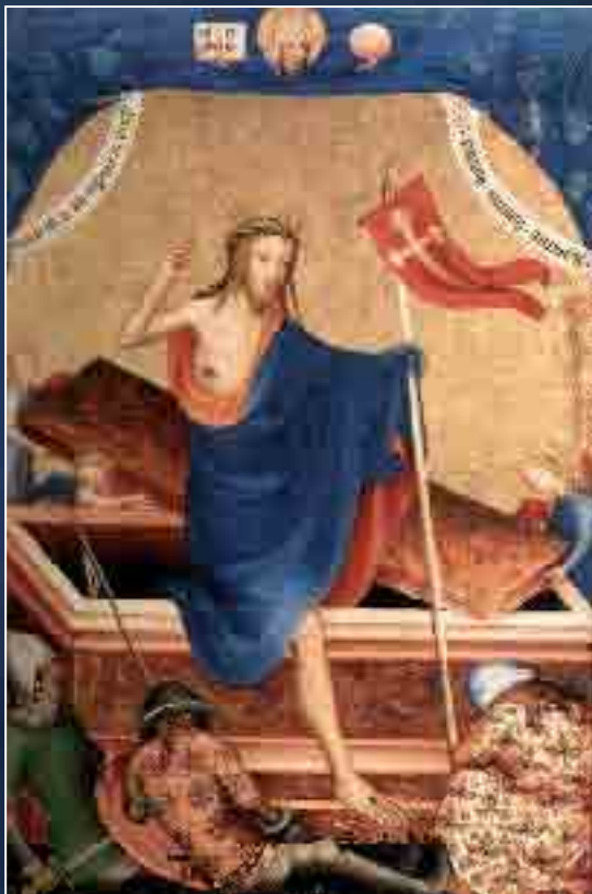
Zmrtvýchvstání, neznámý autor z poč. 15. stol. Museum Mayer van den Bergh, Antverpy

Jiřenka rdí se růžemi, nebesa zvučí písněmi, zní světem jásoť vítězný, úpí jen žalář pekelný.