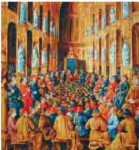
Papež Urban II. (1088-1099) svým projevem na synodě v Clermontu v roce 1095 vyzývá k první křížové výpravě. Ilustrace k rukopisu.

Nepochybně bylo v Jeruzalémě zabito mnoho lidí poté, co křížáci město dobyli. Ale to je nutno chápat v historickém kontextu.