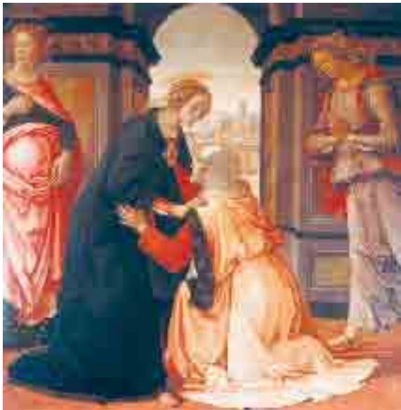
Navštívení, Domenico Ghirlandaio, Musée du Louvre, Paris