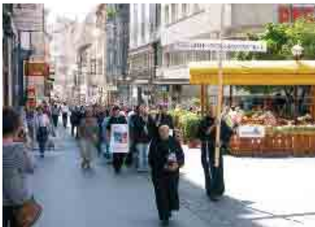
10. brněnský pochod pro život (19.6.2004)

V naší skupině byli staří lidé, rodiny s dětmi, mládež, jeden řádový bratr a řeholní sestra. Obdivoval jsem pokoru starých lidí, neboť i oni byli na cestě vystavováni nadávkám a výhrůžkám několik nepřá-