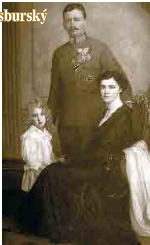
Mladý císařský pár po nastoupení na trůn s korunním princem Ottou (reprodukce obrazu J.Koudelky).

Karel Habsburský se narodil 17. 8. 1887 na zámku Persenbeug v Dolních Rakousích. Byl prvorozeným synem rakouského arcivévody Otto Františka Josefa, jenž byl mladším bratrem Františka Ferdinanda d'Este. V době svého příchodu na svět byl Karel pokládán za „arcivévodu mimo pořadí“, bez jakýchkoliv reálných šancí stát se někdy dědicem trůnu. Tato situace se příliš nezměnila ani po smrti korunního prince Rudolfa v lednu 1889. Teoretická možnost, že se jednou stane přece jen následníkem trůnu, se poněkud zvýšila teprve v roce 1900, kdy následník František Ferdinand uzavřel společensky nerovný sňatek s hraběnkou Zofíí Chotkovou a při této příležitosti musel slavnostně příslibit, že se vzdává nástupnických práv pro své děti ve prospěch svého mladšího bratra Otty a jeho dětí. Vzhledem k tomu, že ještě počátkem roku 1914 byl František Ferdinand stále jen následníkem staříčkého mocnáře Františka Josefa, vše nasvědčovalo tomu, že eventuální nástup Karla Habsburského na trůn by mohl být aktuální teprve tak od 30. let 20. století. Vývoj událostí však zcela změnil sarajevský atentát a po něm následující vypuknutí I. světové války. Arcivévoda Karel se po smrti Františka Ferdinanda (28. června 1914) náhle stává jediným vážným následníkem císařského trůnu.