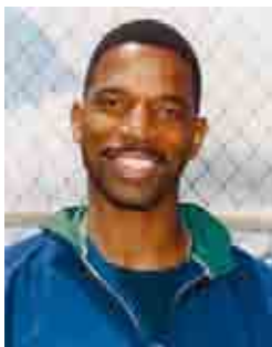
basketbalista A. C. Green

Odhaduje se, že až 16 procent děvčat a 10 procent chlapců ve věku zhruba 15-25 let se rozhodlo v Americe složit tento slib. Hnutí se šíří dál, vznikly první organizace v Evropě i v Africe. V sousedním