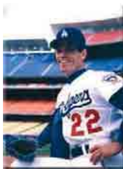
baseballista Brett Butler