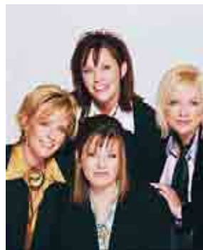
skupina Point of Grace