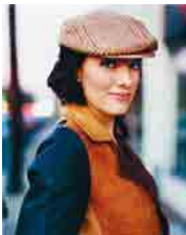
zpěvačka Rebecca St. Jamesová