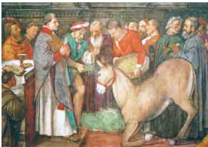
Mezek se klaní svátostnému Spasiteli, když se mu lidé klanět zdráhali.

Bylo bylo nejen jevištěm tiché modlitby a kajícínosti Antonínovy, ale také mnohých zázračných událostí, jimiž Bůh všude oslavoval svého služebníka. Uvádím některé zázraky, např.: uzdravení ženy, jež byla surovým manželem téměř připravena o vlasy, vzkříšení dvou dětí, z nichž jedno se v nepřítomnosti matky zadusilo v kolébce a druhé spadlo do kotle naplněného vařící vodou. Zde, v té samotě, se mu také zjevila nejláhodnější Panna Maria, která ujišťovala milovaného citele, že nejen podle duše, ale i podle těla byla vzata do ráje a zároveň jej vybízela, aby toto její vyznamenání bez bázně všude zvěštoval.