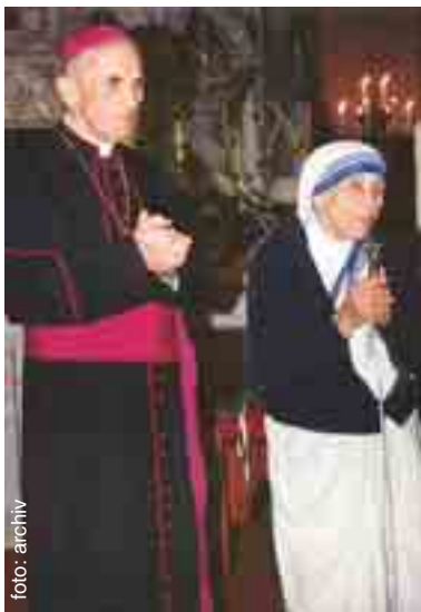
Matka Tereza s arcibiskupem Vaňákem v olomoucké katedrále v 1990 roce.

Byla oblečena tak, jak jsme ji znali. Typický hábit, ošoupané boty, obyčejná taška, z které si vytáhla růženec a neustále jí rukama probíhala zrníčka. Obě řeholnice byly tiché, nemluvíly spolu.