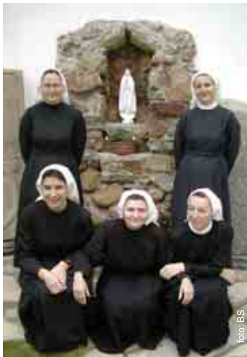
Jihlavská komunita Milosrdných sester III. řádu sv. Františka.

V minulosti, od r. 1883, v Jihlavě pracovaly Milosrdné sestry sv. Karla Boromejského. Po nástupu totality musely Boromejky Jihlavu opustit. Zápis v místní kronice praví: „27. září