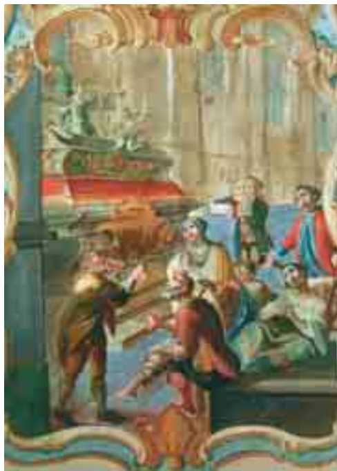
Poutníci přicházejí k hrobu sv. Josefa Kopertinského a prosí ho o přímlyvu ve svých starostech.

V roce 1963, tři sta let po smrti světce, byl proveden průzkum ostatků, které byly přeneseny do umělecky zdobené pozlacené bronzové urny v nové kryptě pod presbytářem basiliky. V roce 1967 u příležitosti dvoustého výročí kanonizace, byl Josef prohlášen za hlavního patrona města Osimo. V roce 1982 vzniklo u basiliky Centrum pro zkoumání a dokumentaci díla sv. Josefa z Kopertina, které organizuje symposia a věnuje se zkoumání osobnosti sv. Josefa především pod zorným úhlem jeho mystických schopností. Dva časopisy propagují v Osimu úctu ke světci: Pax et bonum a také La Fede e i giorni .