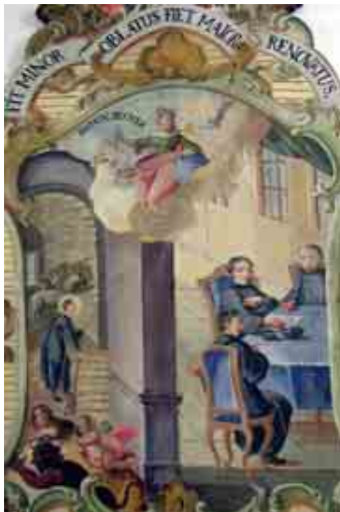
Obraz znázorňující rozhovory představených o připuštění Josefa Kopertinského ke kněžskému svěcení.

Svatý Josef byl bezesporu nejproslulejším svatým mezi těmi, kteří byli pronásledováni inkvizicí. Jeho svatost byla pod stálým dohledem a on sám byl stále izolován od světa a vězňen v klášteřích. 25. listopadu 1638 byl poprvé předvolán před inkviziční tribunál v Neapoli. Obžaloba zněla následovně: „Našími provinciemi prochází člověk ve věku třiatřiceti let, který jakoby nový mesiáš přitahuje zástupy lidí a činí zázraky na každém kroku, kterým lidé věří, protože nejsou schopni odlišit pravdu od toho, co se jen pravdě podobá. Je třeba uvědomit o tom představené, aby se pře-