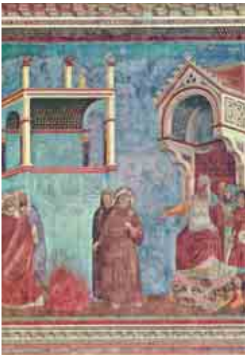
Assisi, Bazilika sv. Františka, freska od Giotta

„Pochybují velice,“ odvětil sultán, „že by některý z našich duchovních měl chut jít kvůli své víře do ohně, nebo snášet pro ni nějakou bolest.“ Řekl to proto, poněvadž uviděl, jak jeden z jeho nejstarších a nejváženějších kněží, který stal nedaleko jeho trůnu, rychle se vzdáli, když uslyšel o návrhu Františkově. „Tak tedy,“ pokračoval František, „slíbíš-li mi, že ty i tvůj lid se obrátíte k pravé víře v Ježíše Krista, sám vstoupím do ohně. Když mě plameny sežehnou, přičítej to jen mým hříchům, vyjdu-li však