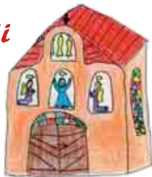
SABINA CHLUPOVÁ 12 LET