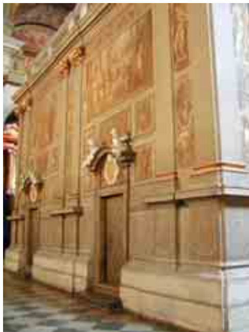
Nazaretský domek Panny Marie z Nazareta v Brně

V současné době nám však nemalé starosti působí poškození stavby a její statiky, díky nevhod-