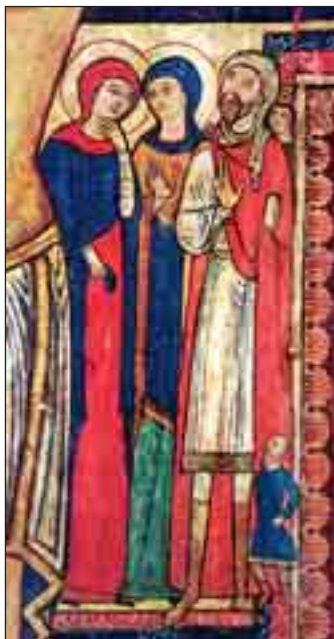
Marie Magdaléna, Marie Kleofášová a setník

Marie Magdaléna je také první ohlašovatelkou pravdy o zmrtevýchvstání Páně. Závěr Markova evangelia obsahuje zmínku o jejím setkání se Zmrtevýchvstalým. Ta má nepochybně velký význam pro víru prvního křesťanského společenství. „ Po svém zmrtevýchvstání ráno první den v týdnu se Ježíš zjevil nejdříve Marii Magdalské. Ona šla a oznámila to těm, kdo bývali s Ním, ale teď truchlili a plakali “ (srv. Mk 16, 9-10). Podle této události obdržela Marie Magdalská v prvotní křesťanské tradici vznešený titul apostola apostolorum (apoštolka apoštolů). Díky svému svědectví mezi apoštoly, ještě před sesláním Ducha Svatého, byla první misionářkou. Díky zjevení zmrtevýchvstalého Ježíše, kterého se jí dostalo, rodila k víře apoštoly, znovu jim vrátila víru. Svou prostou a zároveň milující vírou má i ona účast na přivedení Krista na svět a přičinila se k hlásání Radostné zvěsti.