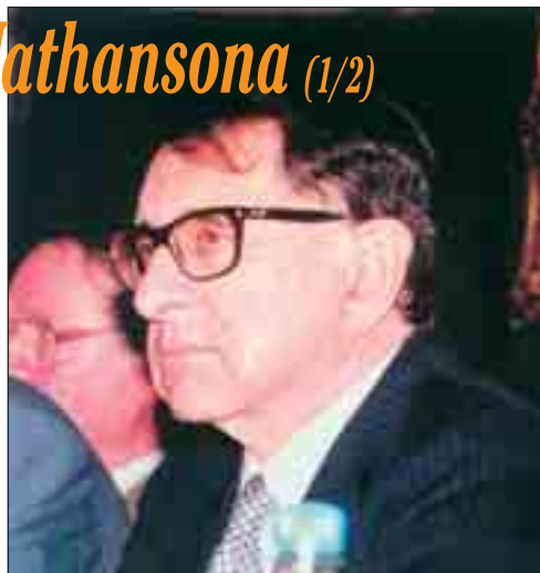
Dr. Bernard Nathanson

Bernard Nathanson, profesor z Cornell University, narozen v roce 1926 byl ateistou a jedním z největších světových zastánců potratů. Neúnavně usiloval o to, aby se potraty v USA staly legální, levné a dostupné. V roce 1968 byl jedním ze zakladatelů National Abortion Rights Action League (Národní liga boje za právo na potrat). Vedl největší potratovou kliniku ve Spojených státech. Přiznává se k provedení 75 000 potratů. Nyní říká s velkou bolestí: „V tomto počtu se nachází i mé vlastní nenarozené dítě, které jsem usmrtil vlastníma rukama.“ Avšak v životě Nathansona se uskutečnil zázrak proměny srdce a smýšlení. Z čelního světového potratáře se stal přední ochránce života nenarozených dětí. Po mnoha letech přípravy přijal křest v katolické církvi.