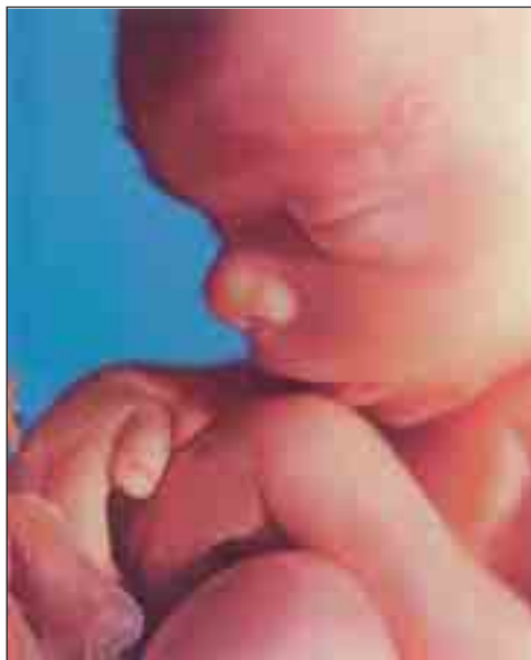
Malý člověk - 5. měsíc života

Třetím způsobem působení bylo podporování věrohodnosti propagační akce blokováním informací o vědeckých důvodech svědčících o tom, že