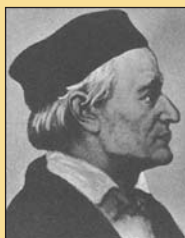
Karl Friedrich Gauss (1777-1855)

Na den 2. května 1999 je plánováno blahořečení otce Pia, který je znám jako „kapucín se stigmaty“. Francesco Forgione, jak znělo jeho občanské jméno, se narodil v roce 1887 a zemřel v roce 1968. Proces blahořečení začal v roce 1982.