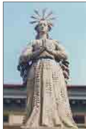
Socha Panny Marie Budějovické na vrcholu sousoší.

Celek je pozoruhodnou barokní památkou, která má pro České Budějovice symbolický význam. Podle staré lidové tradice prý město stihne veliké neštěstí, pokud by bylo sousoší přemístěno. Po r. 1950 skutečně došlo k tomu, že sousoší bylo nejen přemístěno, ale dokonce rozebráno a zcela odstraněno. Ačkoliv se snahy o jeho znovupostavení objevily již koncem šedesátých let, nová instalace se uskutečnila až v letech 1991-93, a to poněkud dále od původního stanoviště s ohledem na novou dopravní situaci. Poškozené sochy nahradily vy-