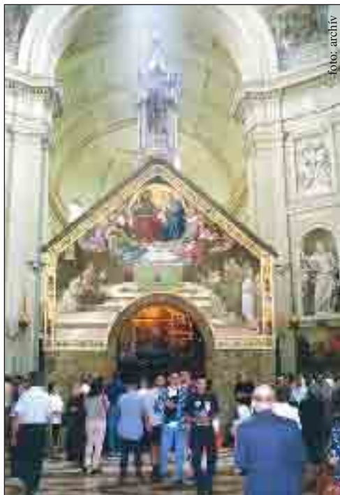
Porciunkula, nad kterou se nyní klene Bazilika Panny Marie Andělské, je v péči bratří františkánů.

„O tomto místě jeden bratr Bohu oddaný měl před svým obrácením vidění, jež stojí za vyprávění. Viděl okolo tohoto kostela bez počtu lidí stížených slepotou, klečících s tvářemi k nebi obrácenými. Všichni s rukama vzhůru vztaženými v slzách volali k Bohu, prosíce o milosrdenství a světlo. A hle, z nebe sestoupila nesmírná jasnost a rozlila se na všechny, každému navrátila zrak