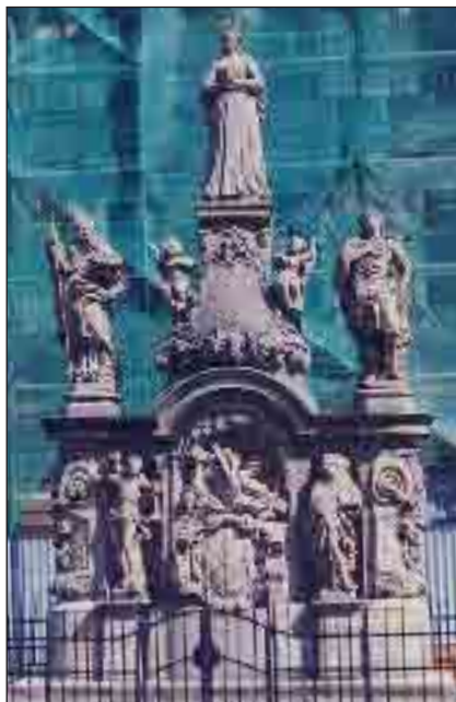
Sousoší Panny Marie Budějovické.

V nikách spodní části soklu mariánského sousoší jsou pak osazeny figury obvyklých morových patronů: sv. Šebestiána přivázaného ke kmeni stromu, sv. Rocha v oděvu poutníka a v umělé jeskyňce - nad znakem města - ležící poustevnici sv. Rozálie s lebkou. S těmito svěťci se setkáváme na morových sousoších velice často. Voják a mučedník sv. Šebestián žil pravděpodobně v 3. stol. a jako ochránce proti moru je uctíván od 7. stol. proto, že v Římě ustala morová epidemie, když byly ulicemi nesený jeho ostatky. Je zo-