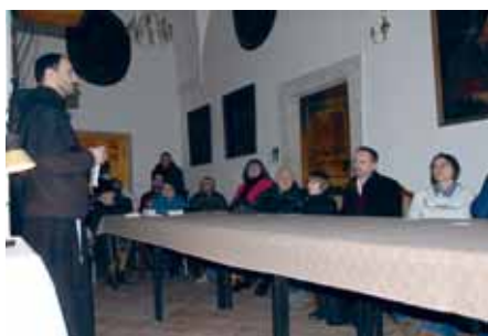
Promítání o sv. Maxmiliánovi, Praha 23. 2. 2012