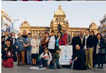
Pochod pro život, Praha 24. 3. 2012