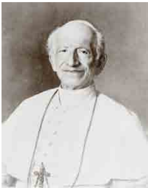
Gioacchino Pecci – papež Lev XIII. (1878–1903)

Po smrti papeže Pia IX. roku 1878 jako kardinál komoří řídil volbu nového papeže a byl pak sám zvolen v krátkém termínu Petrovým nástupcem a přijal jméno Lev XIII. Mezi Vatikánem a italským státem po likvidaci papežského státu v letech 1870–1871 panoval velmi napjatý vztah. Papež se považoval za vatikánského vězně. Papežské požehnání, obvykle udělované po volbě shromážděnému lidu na Svatopetrském náměstí, bylo uděleno pouze lidem v bazilice z vnitřní lodžie. Také korunovace Lva XIII. se konala v Sixtinské kapli.