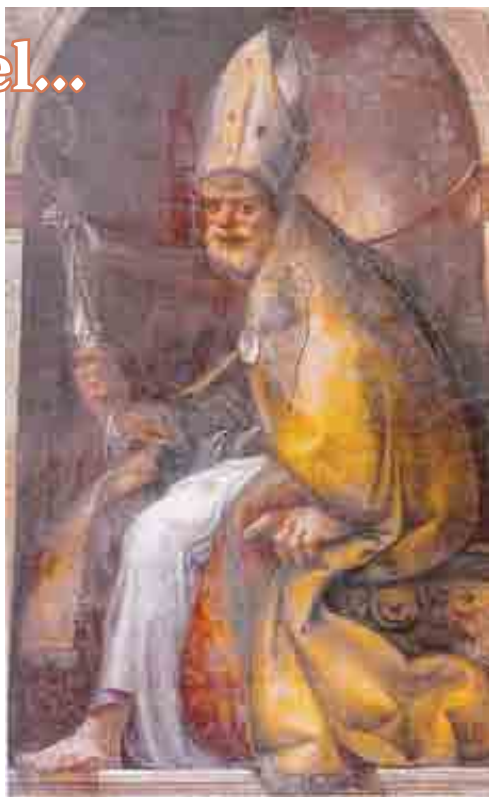
sv. Hilarius z Poitiers, freska od Permianina, r. 1522, Parma, Itálie

Vynikl i jako církevní spisovatel, napsal řadu spisů, v nichž vyvrací Ariovy bludy, a také velmi zdařilý komentář k Matoušovu evangeliu. Jeho