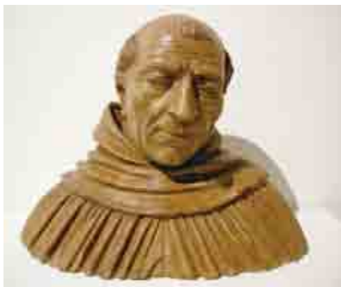
Busta sv. Alberta Velikého zvaného doctor universalis, Vincenzo Onofri, r. 1493

Pozoruhodným vynálezce byl také františkánský mnich Roger Bacon ve 13. stol., profesor v anglickém Oxfordu. Věnoval se zejména fyzice a optice. Objevil lom světla a vynalezl skleněné čočky, které se staly základem pozdějších brýlí. Jako první na světě vypracoval projekt parního stroje, parní lokomotivy a železnice, který byl realizován až v 18. stol. v Anglii, kde pára sehrála významnou roli při rozvoji průmyslové výroby. Právě na základě Baconových studií sestrojil Angličan James Watt