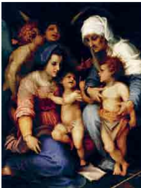
Andrea del Sarto, Madona s Ježíškem a sv. Alžběta s Janem Křtitelem, Louvre, Paříž