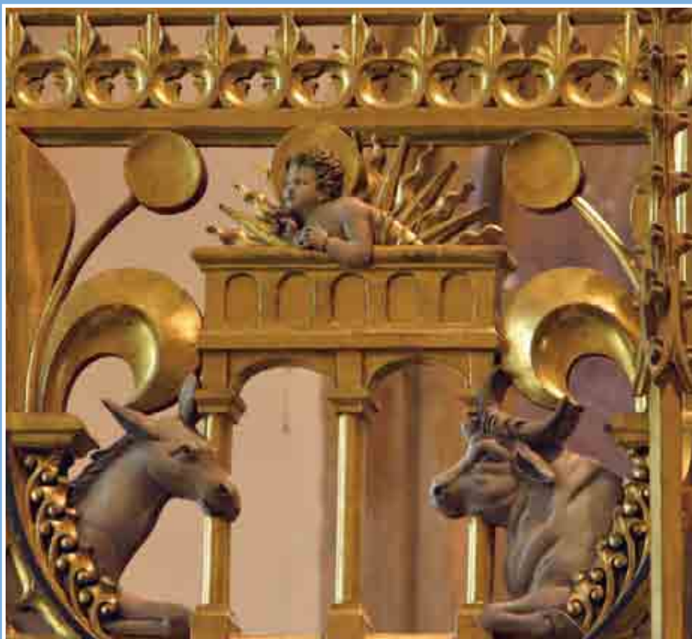
Detail zdobené přepážky z katedrály v londýnském Southwarku.

Kristus je u proroka Malachiáše označen jako Slunce spravedlnosti, na jehož paprscích je uzdravení (srv. Mal 3,20). Zde je znázorněn jako dítě i jako vzcházející slunce s paprsky, které má osvětlit každého člověka a vysvobodit ho z temnoty hříchu a nevědomosti, kdo je Pán a Spasitel. Osel a vůl nám připomínají slova proroka Izaiáše: „Vůl zná svého hospodáře, osel jesle svého pána, mne však Izrael nezná, můj lid je nechápavý“ (Iz 1,3).