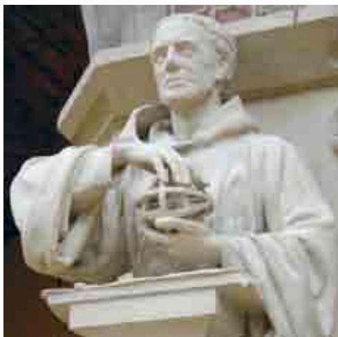
Socha Rogera Bacona, Oxfordské univerzitní muzeum, Anglie

dokonalejší parní stroj, použitelný v dopravě jako lokomotiva. Bacon také načrtl jako první na světě schéma dalekohledu a drobnohledu, což se dočkalo své realizace až v 17. stol. (Kubeš..., str. 400). Bacon také spolu s Robertem Gossetestem, františkánem a rektorem oxfordské univerzity, objevili experimentální metodu v přírodních vědách jako nezbytnou podmínku k dosažení výsledku a prohlásili laboratorní pokusy za první a základní postup pro každého, kdo se chce věnovat chemii, fyzice, botanice nebo zoologii (d'Souza..., str. 86).