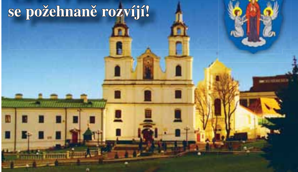
Pravoslavná katedrála Svatého Ducha v Minsku. Erb města Minsk.

Český občan ví o Bělorusku zpravidla jen tolik, že tam vládne diktátor Alexander Lukašenko. Tak jednoduché to však není. Měl jsem možnost pobývat týden v této rovinaté, ale krásné a lesnaté zemi se stejným počtem obyvatel jako Česká republika, rozlohou však čtyřikrát větší.