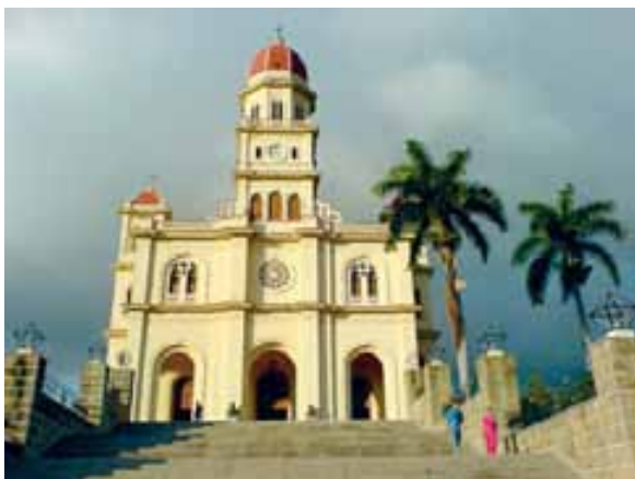
Kubánská národní poutní bazilika v Cobre

rolí při formování kubánského vlastenečství. V dnešní době je Panna Maria z Cobre symbolem nelehkého zápasu za občanská práva a náboženskou svobodu. Odvážný pastýřský list kubánských biskupů z r. 2003, pranýřující pronásledování katolíků, končí prosbou k Matce Boží: „V dětské oddanosti vzýváme požehnané jméno svaté Marie milosrdné z Cobre. My všichni se utíkáme pod její ochranu. Ona jako milující Matka stále bdí nad opravdovým blahem nás všech, svých milých dětí. Tobě, Matko, pokorně svěťujeme plody našeho utrpení. Kéž posílnění touto nadějí všichni trpělivě, nezištně a plni lásky pracujeme pro současné i budoucí blaho země.“