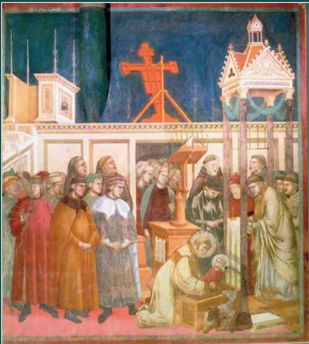
Sv. František slaví první jesličky v Grecciu. Giotto di Bondone, freska v Bazilice sv. Františka, Assisi.