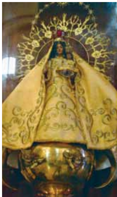
Milostná soška Panny Marie nazývaná Matka Boží Milosrdná

Cobre se rychle stalo kubánskou národní svatyní. Jak ukazují historikové, Matka Boží Milosrdná byla a je součástí kubánské národní identity a poutě k ní sehrály důležitou