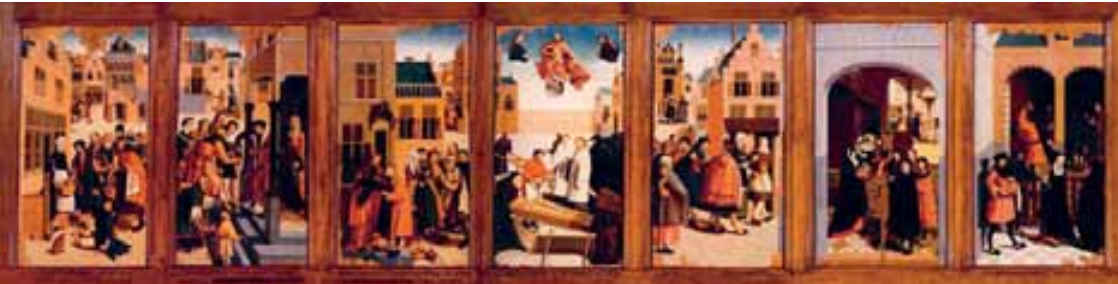
Sedm skutků tělesného milosrdenství (sytit hladově, napojit žíznivě, odít nahé, pohřbit zemřelé, ujmout se pocestných, navštívit nemocné, navštívit vězně), Mistr Alkmaar, Rijksmuseum, Amsterdam.

Evangelní příběhy samařské vesnice a cizoložné ženy jasně ukazují, že Ježíš Kristus nechce trest smrti za odlišné přesvědčení a za manželskou nevěru (ten byl nota bene nespravedlivě aplikován pouze vůči ženám, nikoli mužům, kteří zhrěšili smilstvem). Toho se držela i církev po r. 380, kdy křesťanství se stalo státní ideologií. I když pohanské kultury císařové zakazovali (hlavní příčinou byly magie, rituální smilstvo a někdy i lidské oběti), nikdy nelegalizovali pro pohany trest smrti za jejich přesvědčení, pohané jsou v senátě i mezi státními úředníky. Církev také bránila násilným