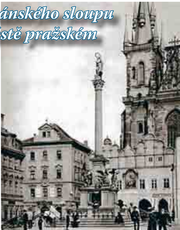
Mariánský sloup byl dominantním a kompozičním centrem náměstí. Odbýval se u něho náboženský i občanský život.

Pražané svůj slavný slib daný v největší tísni dodrželi. Po skončení války podali žádost císaři Ferdinandu III., který jejich návrh podpořil a jako mariánský ctitel se v této iniciativě osobně anga-