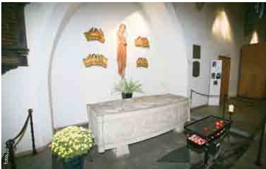
Hrob bl. Jana Dunse Scota v minoritském kostele v Kolíně nad Rýnem