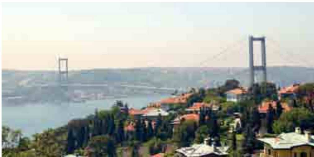
Most přes úžinu Bospor spojující Evropu s Asií.

Dnešní Istanbul je metropolí, v níž se modernost v západoevropském stylu překvapivě snoubí s ru-