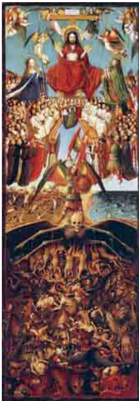
Jan van Eyck, Poslední soud (1420-25), Metropolitan Museum of Art, New York

Poté, co jsme prozkoumali různé aspekty očekávání Kristovy parusie, přejdeme k následující otázce: Jaká