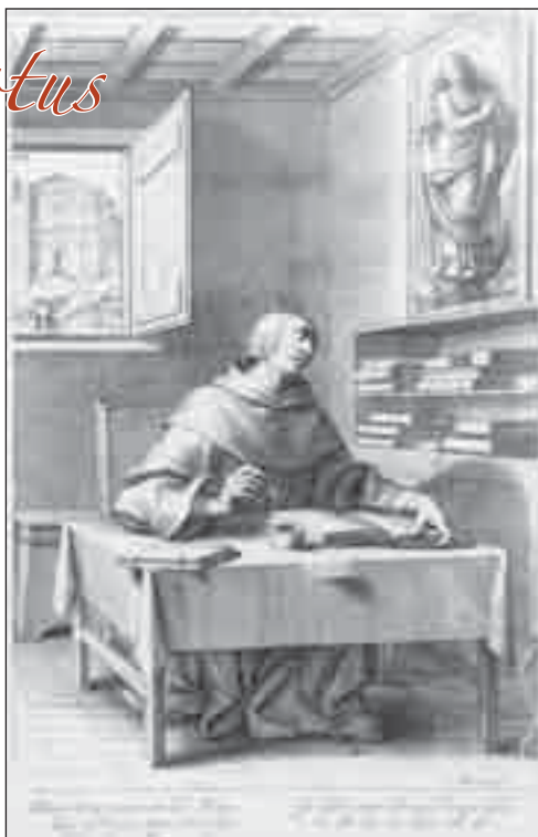
Rytina: Jan Duns Scotus píše obhajobu Neposkvrněného Početí

Současníci Scotovi, včetně jeho četných odpůrců, pro něj vymysleli titul Doktor subtilis, což bychom přeložili jako Učitel jemných odstínů. Nelze popřít, že v tom bylo i trochu ironie ze strany těch, kteří s ním