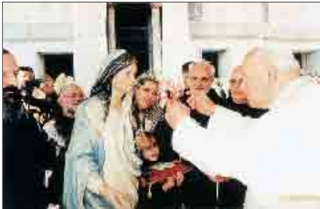
Koronovace sochy Panny Marie z Nazareta korunkou z dvanácti hvězd (15.4.98)

neschválené nebo neprověřené skutečnosti. Mnozí katolíci v naší zemi mají k Matce Boží krásný vztah. Zde vidím velkou příležitost ke spojení se s celou církví na přípravě Velkého jubilea. Zároveň si slibují - a to nesu před Pána ve víře - že Mariino navštívení naší vlasti bude jistým způsobem právě onou jemnou, naléhavou výzvou k zamýšlení a ke změně. Její pouť u nás by neměla provokovat, ale také by neměla zůstat skrytá. Výzva je jako světlo. Musí být vidět. Je zde velká příležitost, abychom se spojili bez vzájemných předsudků a co nejjasněji rozvinuli poslání Panny Marie z Nazareta jako Ženy a Matky všech národů. Myslím, že všichni lidé na zemi bez rozdílu náboženského či politického přesvědčení mají jednoho Otce. Boha Otce. Nikomu nechci toto moje poznání vnučovat a už vůbec ne to druhé - že všichni máme jednu Matku. Tu, která promlouvá nyní na prahu Velkého jubilea 2000 ke svým dětem: Navraťte se do Otcova domu.