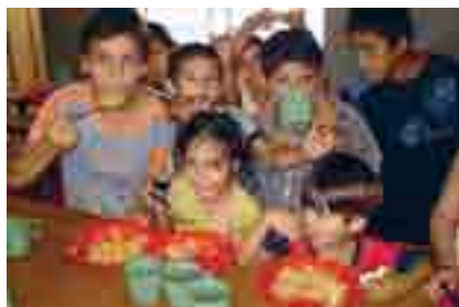
Děti v jídelně

V Paraguayi je 90% katolíků a všichni mají silné vědomí Boha. Není tedy zapotřebí učit je víře, jako by to byli pohané. Např. obraz Pána Ježíše Milosrdného můžete najít téměř všude – nejen v kostelích, ale i v obchodech, taxících, úřadech, na policii atd.. Existuje však jiný problém. Lidé neumí víru žít prakticky. Kněží je poskrovnu a kvůli tomu jsou věřící jako ovce bez pastýře. Chybí jim vysvětlování víry a její zavádění do každodenního života. Stává se také, že prvky