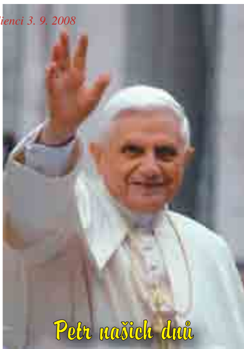
Petr našich dní

V prvotní církvi byl křest nazýván také „osvícením“, protože tato svátost dává světlo, dovoluje vidět reálně. To, co se takto označuje v teologii, se Pavlovi děje fyzicky. Je uzdraven z vnitřní slepoty, vidí dobře. Sv. Pavel byl tedy proměněn nikoliv nějakou ideou, nýbrž událostí, neodolatelnou přítomností Zmrtvýchvstalého, o níž nebude moci již nikdy v budoucnu pochybovat; tak silná byla jistota této události. Setkání s Kristem změnilo Pavlův život od základu. V tomto smyslu lze a je třeba mluvit o konverzi. Toto setkání je jádrem