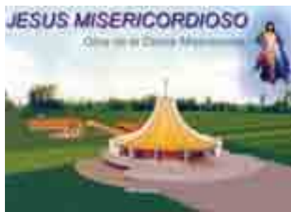
Projekt centra Božího milosrdenství v Areguá v Paraguai

Areguá - třetí místo vzniklo díky šíření se kultu Božího milosrdenství. Farní skupiny Božího milosrdenství vznikají dosud spontánně a zdá se, že je to celostátní fenomén. Toto hnutí potřebovalo a potřebuje formaci a duchovní patronát. Již devět let organizujeme Kongres Božího milosrdenství, kterého se účastní lidé nejen z Paraguaye, ale i jiných států Jižní Ameriky. Proto vznikla myšlenka vytvořit centrum Božího milosrdenství. A protože jsme dostali darem 4 hektary půdy v Areguá, centrum mělo vzniknout zde. Byly připravené a následně schválené stavební plány a r. 2005 mohla začít stavba. Centrum bylo koncipováno jednak jako místo kultu a také jako charitativní a vzdělávací středisko.