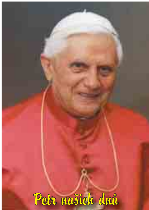
Petr našich dnů

Nicméně, vrátíme-li se nyní k dnešnímu evangeliímu úryvku, k Pánu, který k nám mluví, zalekneme se. „Kdo se nezřekne veškerého svého vlastnictví a nevzdá se také všech příbuzenských vztahů, nemůže být mým učedníkem.“ Chtěli bychom namítnout: ale co to říkáš, Pane? Nemá snad svět zapotřebí právě rodinu?