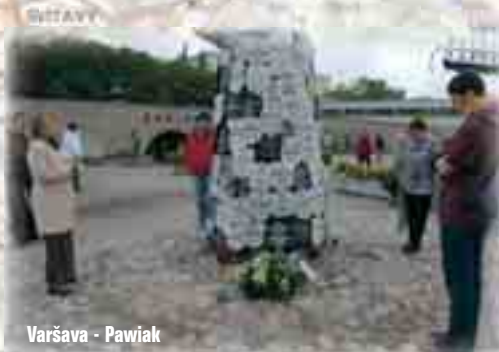
Varšava - Pawiak