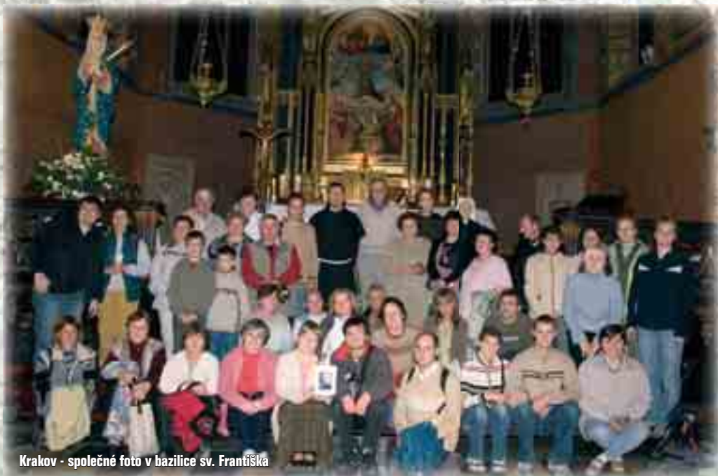
Krakov - společné foto v bazilice sv. Františka