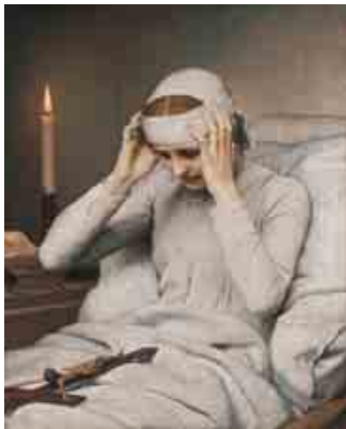
Grafika: Gabriel Cornelius von Max

Zjevení Kateřiny Emmerichové, jež zahrnují události začínající se Poslední večeří na Zelený čtvrtek, přes uložení do hrobu po šestnácté hodině odpolední podle našeho počítání času na Velký pátek, měla mimořádný význam v období osvícenského racionalismu, rozmáhajícího se deismu a vznikání stále nových a nových postprotestantských denominací. Naše mystička žila ve zvlášť složitých časech množících se případů odpadnutí od víry, na kterémžto jevu mají velkou zásluhu kromě jiného i vědecké objevy 17. stol. Fascinace člověkem jako pánem veškerého stvořeného světa ve století šestnáctém byla úzce spjata s odmítnutím tradice Martinem Lutherem. Století osmnácté je ve znamení expanze přirozeného náboženství – náboženství bez kultu a dogmat – a deismu, nauky uznávající pouze to, že Bůh stvořil svět, z čehož však pro život jedince nevyplývají žádné závěry. V tomto dobovém kontextu tak dílo německé řeholnice, jehož vznik byl spojen s velkým fyzickým a duševním utrpením autorky, získává nový, zásadnější rozměr. Nejde jen o samotný text – ryze katolický a ortodoxní. Přijmeme-li tyto nezvykle sugestivní obrazy Kristova umučení, vyvstane nám před očima nový typ mystického prožitku. Je jen málo děl, po jejichž přečtení změníme svůj dosavadní náhled na nějakou skutečnost. Naše znalost evangelní verze těchto událostí nám přechoťo brání v opravdové představě o strašlivosti