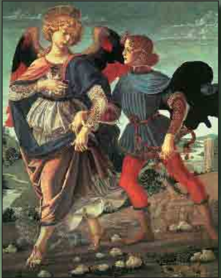
Andrea del VERROCCHIO, Tobiáš a anděl, r. 1470-80, tempera na dřevě, National Gallery, Londýn

K do přebýváš v ochraně Nejvyššího, kdo dlíš ve stínu Všemocného, řekni Hospodinu: „Mé útočiště jsi a má tvrz, můj Bůh, v něhož doufám!“