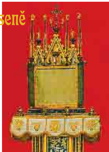
Krví potřísněný korporál z roku 1263 uchovávaný v Orvietu

Turisté a poutníci, kteří navštěvují katedrálu v Orvietu, obrácejí hned potom své kroky do Bolseny, aby se v kostele sv. Kristýny poklonili u místa, na kterém došlo k zázraku. Vchod v severním křídle kostela vede do Kaple zázraku, ve které skvrny na dlaždicích podlahy mají být skvrnami krve, pocházející ze zázračné hostie. Sám oltář, na kterém došlo k zázraku, se v současné době nachází v jeskyni sv. Kristýny.