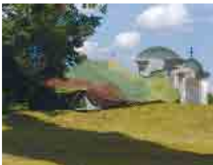
"Stan setkávání" nezel nikdy prázdnotou...