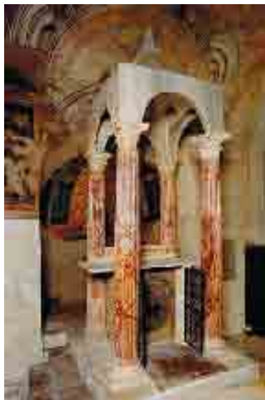
Oltář u hrobu sv. Kristýny v Bolseně. Zde se odehrály zázračné události z roku 1263.

Podle historického podání, vlivem tohoto zázraku, papež Urban IV. poposíl sv. Tomáše Akvinského, aby sestavil vlastní texty pro mši sv. o Eucharistii a oficiem (modlitbu breviáře) ke cti Nejsvětější eucharistie jako Kristova Těla. Příští rok v srpnu ustanovil papež Urban IV. zvláštní bulou slavnost Božího Těla.