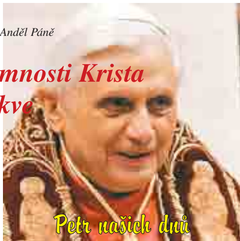
Petr našich duší

Před nadcházejícím synodálním shromážděním v říjnu biskupové, kteří budou jeho členy, probírají „pracovní text“, který byl pro ně připraven. Proto žádám celé církevní společenství, aby se cítilo zahrnuto do této bezprostřední přípravné fáze a aby se na ní podílelo modlitbou a zamyšlením tak, že využije každou příležitost, událost a setkání. Také na nedávném Světovém dni mládeže bylo velmi mnoho odkazů na eu-