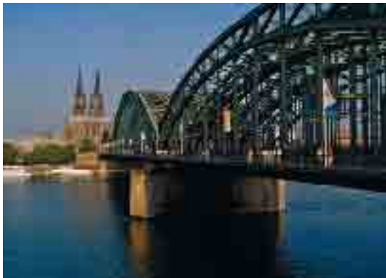
Most přes Rýn. V pozadí kolínský Dóm s ostatky Tří králů.

Dalším důležitým bodem byl příjezd papeže do Kolína a jeho pouť do kolínského dómu. Všude kolem