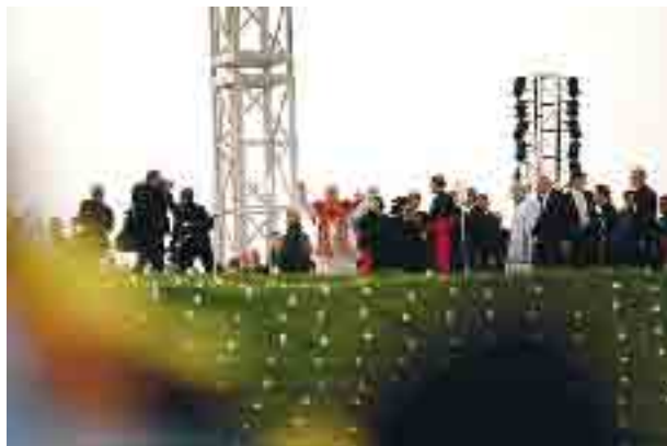
Papež zdraví mládež při sobotní vigílii.

Po promluvě jsme to, co jsme slyšeli, mohli začít realizovat, protože byla vystavena Nejsvětější svátost a my jsme v ní očima víry viděli betlémské Dítě, které se i nás ptalo, zda mu chceme dávat sebe, aby nás