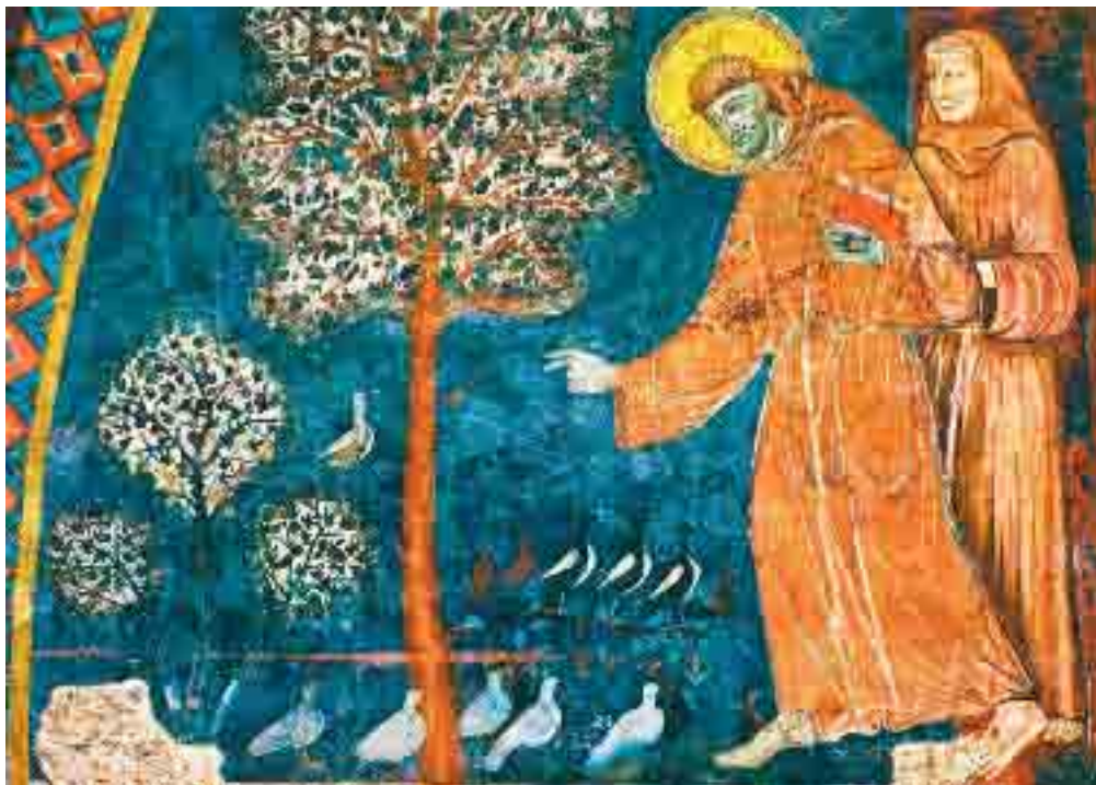
Assis, Bazilika sv. Františka - spodní kostel. Mistr sv. Františka r. 1236 Freska znázorňující Františkovo kázání ptákům.

Ve svých nesmírných bolestech sténal, volal k Pánu, prosil jej ne za odvrácení útrap a bolestí, ale za trpělivost k jejich snášení. Bůh viděl svého služebníka tak velice zkoušeného, neodepřel mu svou útěchu, když jej jedné noci opět prosil o trpě-