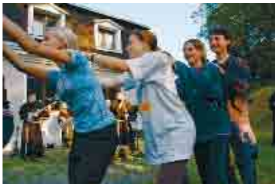
Na Cvilině se radovalo, tančilo a zpívalo, bylo zkrátka veselo a milo...

Úterní Eucharistický průvod pak dal setkání další grády. Nést baldachýn nad Kristem v Eucharistii není výhodné jen v tom, že člověk tak nezmokne, ale jít nějaký čas v těsné přítomnosti Beránka Božího, nechat Ho na sebe působit, cítit se prosakován Jeho milostí, takto se k Němu veřejně hlásit ve městě, ve kterém žiji, věřím a hřeším, cítit požehnání, jaké z Něj přýští ke krnovským, to už je blíže nepopsatelný a nepředatelný prožitek. Nevadí, že pr-