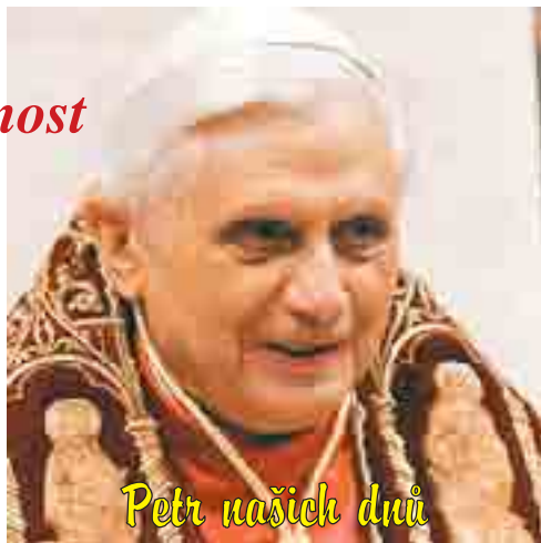
Petr našich duší

Jméno Benedikt kromě toho připomíná mimořádnou postavu velkého „patriarchy západního mnišství“ sv. Benedikta z Nursie, spolupatrona