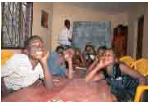
škola v Mosambiku

Další velkou pomocí Komunity Sant'Egidio chudým Mosambiku je služba lidem ve vězení.