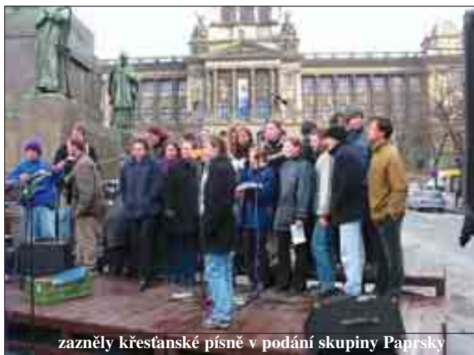
zazněly křesťanské písně v podání skupiny Paprsky