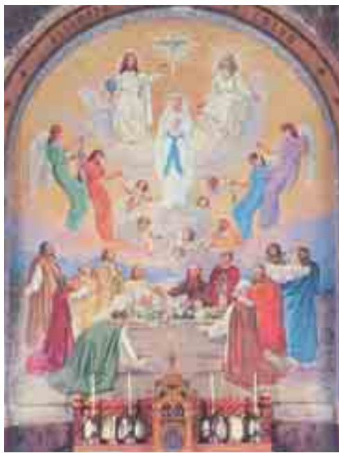
Česká kaple - 4. tajemství slavného růžence - v Růžencové bazilice je darem českých poutníků.

od 8. do 19. srpna 1933. Poutí vedl dr. Pavel Gojdič, řeckokatolický biskup z Prešova, který později byl při pronásledování církve po nástupu komunismu umučen v komunistických žalářích a roku 2001 byl prohlášen Svätým otcem Janem Pavlem II. za blahoslaveného mučedníka.