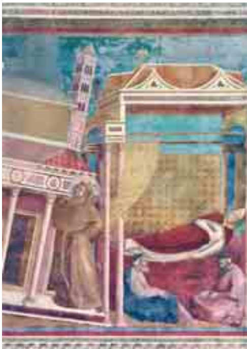
Assisi, Bazilika sv. Františka, freska od Giotta

„Svatý otče,“ důrazně, ale s pokorou odvětil František, „oč prosím, nežádám jménem svým, ale jménem Toho, který mě k vám poslal, totiž prosím o to jménem samého Ježíše Krista.“ Potom podrobně vypravoval papeži vidění, které měl v noci v kostele porciunkulovém.