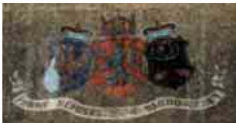
Nad českou kaplí se nachází mozaika zobrazující českého lva, moravskou a slezskou orlici, pod nimi se nachází nápis: „Panně Neposkvrněné národ český.“ Omluvte nízkou kvalitu fotografie pořízené amatérským aparátem.

Roku 1907 měla naše česká kaple v Lurdech slavný den. Konala se česká pouť, při které světití biskup olomoucký, dr. Karel Wisnar, 8. září naši kapli posvětil. Poutníků z Čech, Moravy a Slezska bylo přítomno 350. Kaple s výzdobou byla představena jako „vzácný dar slavné a vznešené dědičství lásky našeho národa k Panně Neposkvrněné“. Česká pouť měla v Lurdech velký ohlas a psalo se o ní ve francouzském tisku. Roku 1911 se konala třetí česká národní pouť do Lurd a zúčastnilo se jí 593 poutníků. V roce 1912 byl v Praze ustanoven Lurdský poutní spolek a konala se čtvrtá národní pouť, které se zúčastnilo 452 poutníků. 13. národní pouť z Československa do Lurd uspořádal pražský Lurdský spolek v době