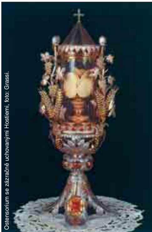
Ostensorium se zázračně uchovanými Hostiemi.

Následujícího dne arcibiskup A. Zondadari při slavnostním procesi, kterého se zúčastnilo na 3 000 obyvatel s pochodněmi a kajícími kříži, přenesl nalezené Hostie zpátky do baziliky sv. Františka. Z celého okolí se scházeli věřící v takovém počtu, že Hostie musely být vystaveny k veřejné účtě po celé dny. Lidé s velikou vírou a láskou adorovali svaté Hostie, a tak se snažili omluvit za způsobenou svatokrádež. Více než 100 nalezených Hostií bylo uděleno věřícím při svatém přijímání. S časem však minorité i ostatní věřící došli k názoru, že nalezené Hostie by se neměly rozdávat ve svatém přijímání, ale měly by se uchovat k veřejné účtě. S uplyvajícími měsíci a léty všichni