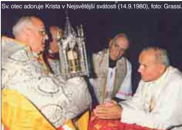
Sv. otec adoruje Krista v Nejsvětější svátosti (14.9.1980)