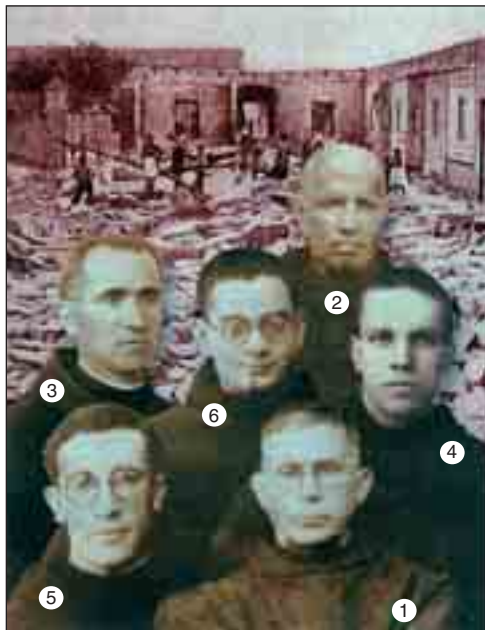
Minorité - španělští mučedníci z roku 1936. V pozadí ruiny minoritského kláštera v Granollersu (Barcelona).