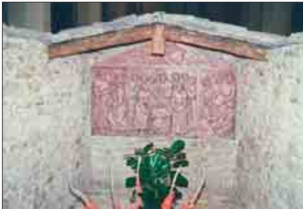
Chatrč v Rivotorto

„Pozoruji, že Bůh chce rozmnožit naše stádo, a proto považuji za vhodné, abychom požádali buď svého biskupa nebo kanovníky od sv. Rufi-