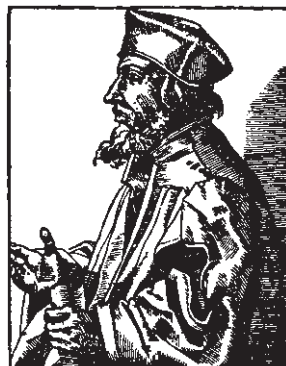
Jan Hus - dřevorez z r. 1587

A ještě něco. Novověké -ismy na rozdíl od katolictví mají násilí proti svobodě svědomí vloženo hned do kolébky. Francouzské bezbožecké osvícenství se hned na počátku své existence legitimovalo jakobínským terorem za Velké revoluce v Paříži,