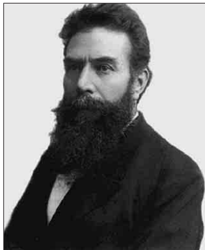
Wilhelm Conrad Roentgen (1845-1923) - německý fyzik, objevitel tzv. X-paprsků (1895), nyní zvaného rentgenového záření. Nobelovou cenu získal v roce 1901.