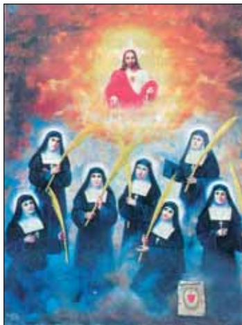
Španělské řeholnice, mučednice z doby občanské války v roce 1936