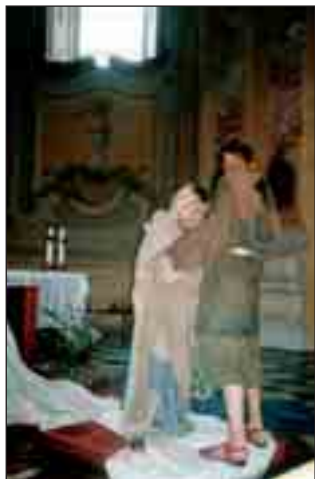
Divadlo o sv. Františkovi a sv. Kláře