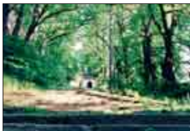
Schody na Cvilině

K poutnímu kostelu Nanebevzetí Panny Marie na Cvilině vede dlouhá řada