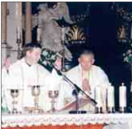
Při bohoslužbě s o. provinciálem - o. Jiljí vpravo

životopis zpracoval br. L. Rzešniowiecki