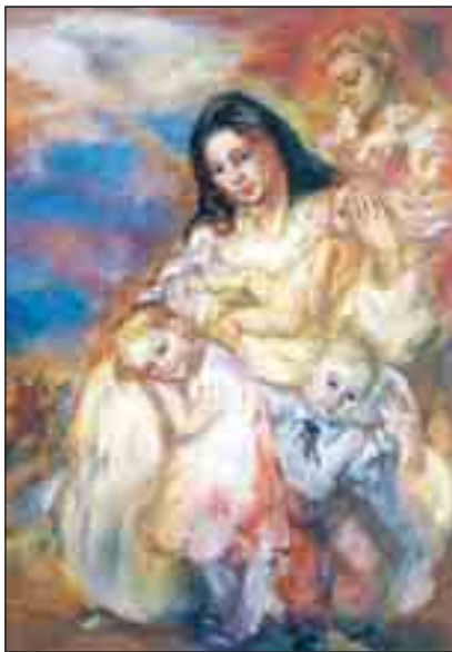
Svatá Zdislava, oroduj za nás a za naše rodiny