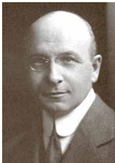
Alexis Carrel, laureát Nobelovy ceny za medicínu (1912)