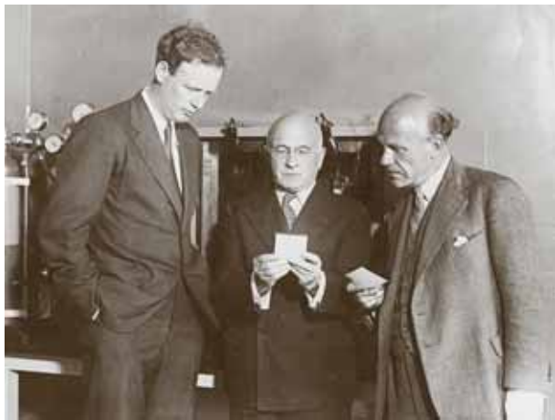
Alexis Carrel a Charles Lindbergh (vlevo). Pracovali spolu na metodách léčby srdce.