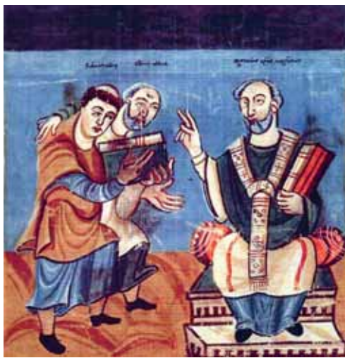
Mladý Rabanus Maurus (vlevo), podporován opatem Alkuinem (uprostřed), podává dílo mohušskému arcibiskupu Otgarovi (vpravo) – z Fuldského manuskriptu okolo 830/40

Nájezd barbarských kmenů a zánik Západořímské říše r. 476 způsobilý mj. i rozpad tehdejšího školství. Po christianizaci nově přichozích národů musela církev zahájit vzdělávací proces od samého začátku, neboť tito lidé byli na rozdíl od Řeků a Římanů primitivní a takřka úplně negramotní bez jakéhokoliv vzdělání. První výsledky se dostavily za vlády franského krále a císaře Karla Velikého v 8. stol. Tento panovník, ačkoliv sám byl analfabet, naléhal na biskupy, aby při svých katedrálách zakládali školy. O totéž usiloval i jeho moudrý