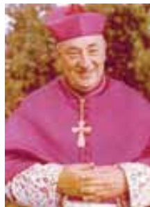
Štěpán kardinál Trochta