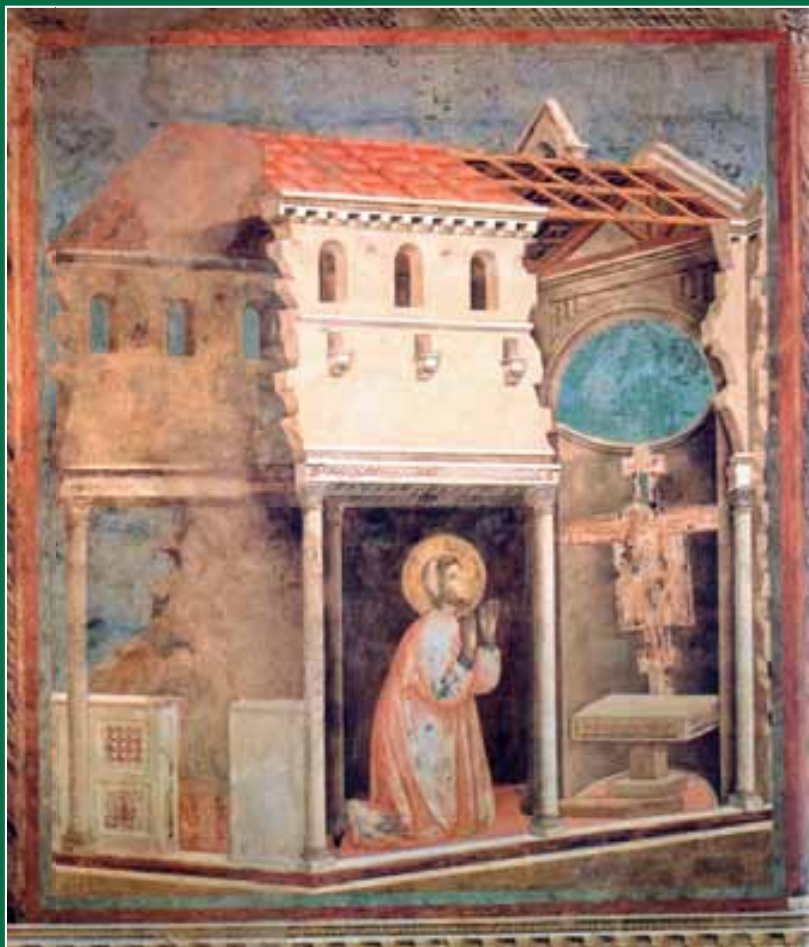
Sv. František se modlí v rozbořeném kostelíku sv. Damiána. Zde uslyšel z kříže Kristův hlas: „Jdi a oprav můj dům!“ Giotto di Bondone, freska v Bazilice sv. Františka, Assisi.

Řád bratří minoritů přijímá nové kandidáty