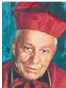
Josef kardinál Beran