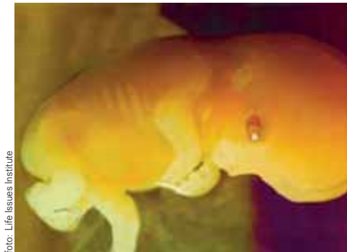
Biologický vývoj člověka: 7. týden od početí