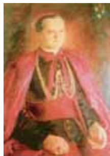
biskup Josef Hlouch