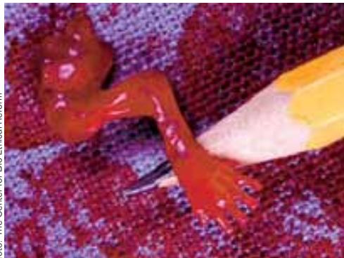
Umělý potrat v 8. týdnu od početí