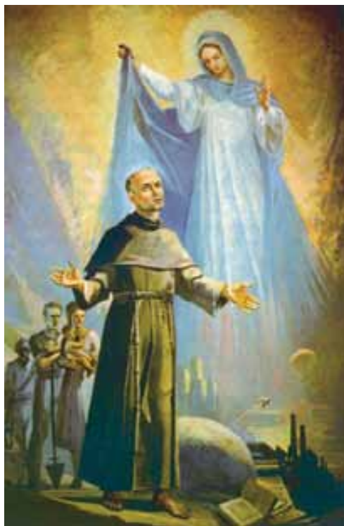
obraz: sv. Maxmilián - apoštol Neposkvrněné, mal. Arone dei Vecchio

A než přistoupil k vyprávění o zakládaci schůzi, na níž byl přijat hlavní program Rytířstva, ještě připomenul tehdejší agresivní projevy římského svobodného zednářství, jemuž Rytířstvo chtělo postavit svou apoštolskou činnost (srov. Spisy 1105).