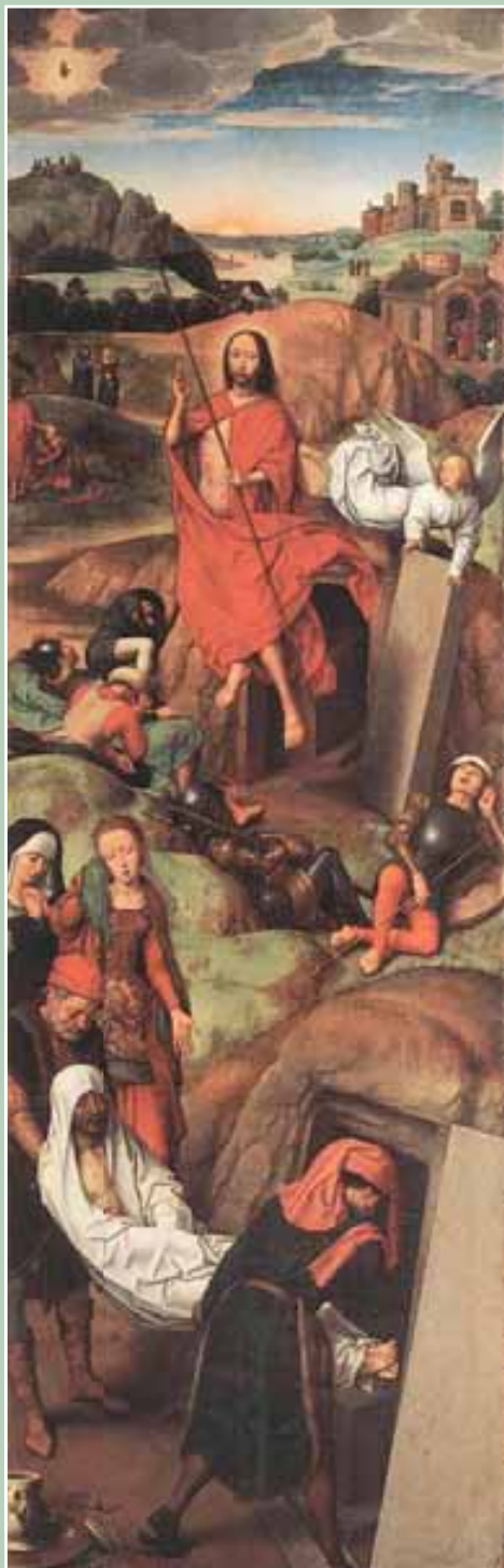
Hans MEMLING, Kristovo umučení a zmrtvýchvstání, pravé křídlo oltářního obrazu, Muzeum umění, Lübeck