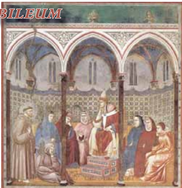
Kázání sv. František před Honoriem III., Giotto di Bondone, freska v Bazilice svatého Františka, Assisi

Bylo to na jaře r. 1209. Když oschly cesty a ukázalo se slunce, vydali se bratři na cestu do Věčného města Říma, šli přes Spoleto, Terni a Orte, až konečně po via Salaria se přiblížili cíli své cesty. V dálece za sebou nechali hory, jejichž vrcholky se ještě tu a tam bělaly ostrůvky sněhu. Cesta byla namáhavá, noci chladné a větrné, ne vždy našli přístřeší a otevřenou ruku, která by podala potřebné k ukojení hladu a žízně. Ale oni byli navzdory všemu bezstarostní, spokojeni s málem a zcela odevzdáni do péče toho, který obléká polní lilie a stará se o ptáky v povětří. Čím více se blížili pouťníci k Římu, tím bylo na silnici živěji: hemžilo se to zde všelijakými lidčkami, kteří spěchali do města za nejrůznějšími záležitostmi, nejčastěji však za obchodem nebo kvůli řemeslu. Občas předjel chodce šlechtic nebo duchovní na koni. Také opačným směrem se ubíralo dosti lidí, kteří si vyřídili své záležitosti a vraceli se domů do vesnic a městeček. Mnozí zvědavě a snad i pohrdavě si prohlíželi nezvyklé chodce, oblečené na stejný způsob – jakoby po selsku – celé uprášené a zablácené, ale přitom s jasnými, radostnými tvářemi. Chvillemi se polohlasně modlili, chvillemi spolu rozmlouvali, chvillemi šli mlčky a jakoby zamyšleni. František nechtěl být vůdce, bránila mu v tom pokora. Proto pověřil vedením bratra Bernarda, jehož nazýval svým „prvorozeným synem“. Bratři se trochu obávali, jak v Římě pořídí, byli nejistí a neměli zkušenost, jak jednat s vysokými kruhy.