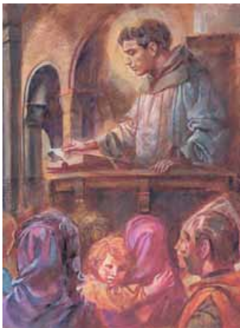
sv. Antonín během kázání, Giorgio Trevisan

„Kapoun?“ řehotal se zpustlý rytíř. Nato však prudce couvl a vykulil oči na krásně voňavou pečínku, na níž si minorita pochutnával. Pod blahoslavenou rukou svěťce se nechutný pták doopravdy proměnil v lahodného kapouna. Tu padl šlechtic,